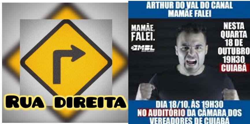
Figura 4: À esquerda, Canal conservador do YouTube Rua Direita; à direita, divulgação de palestra do youtuber Arthur Vidal