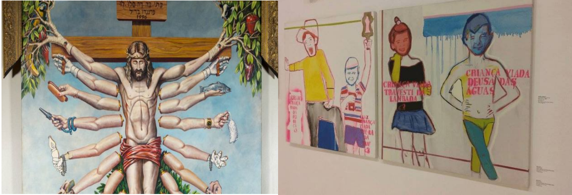
Figura 3: Exposição Queermuseu no Santander Cultural em Porto Alegre (RS) Reprodução/Facebook, 2017

Fonte: Reprodução digital por Mario da Mata